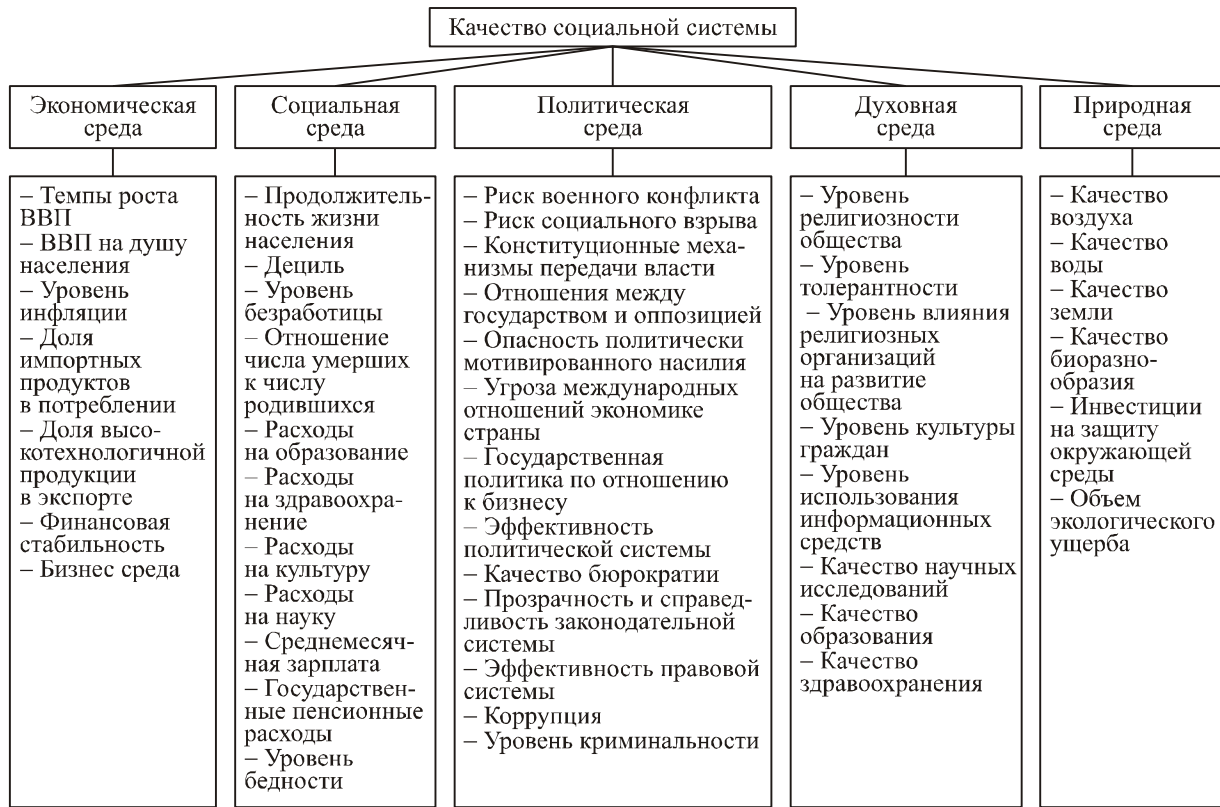
Рис. 1. Система показателей подсистемы социальной системы