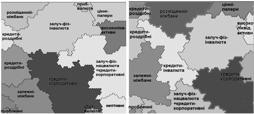
Рис. 2. Розподіл банків на СФГБ з використанням 17 СІ станом на 1 квітня та 1 липня 2015 року

На рис. 2 наведено загальний вигляд карт Кохонена, сформованих за звітністю станом на 1 квітня та 1 липня 2015 року із використанням 17 структурних індикаторів, наданих у табл. 6.